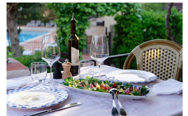
« La Table d'Augustin » : une cuisine locale à base de produits frais et du potager selon saison. La maison produit sa propre huile d'olive et son vin.

pour aller et/ou revenir du centre de Saint-Tropez, l'établissement 4 étoiles fait partie du label « Authentic Hotels & Cruises », créé en 2005 par Christophe Vallet, regroupant la plus belle collection d'hôtels de charme alliant qualité et authenticité dans le monde entier. Envie d'admirer les panoramas majestueux sur les camaïeux bleu-vert de la Méditerranée? Idéalement placée, La Ferme d'Augustin offre un grand éventail de balades : San Remo, Menton, Monaco, Nice, Cannes... À ne pas manquer, la pause dégustation au cœur des vignobles dont celui du Château des Marres : leur showroom sur la Route des Plages, à Ramatuelle, ravit les amateurs de rosés et autres grands vins avec moment de détente au soleil couchant au « 1907 Wine Bar » autour de tapas, cocktails à base de vins du domaine et partie de pétanque dans un décor de carte postale! ■