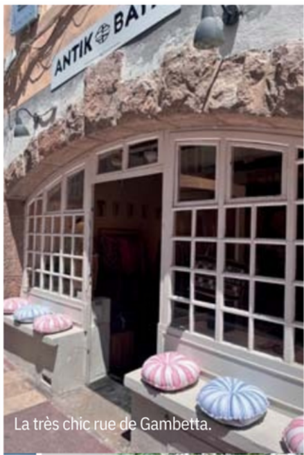
La très chic rue de Gambetta.