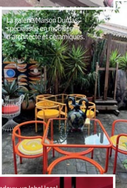
La galerie Maison Dumas, spécialisée en mobilier d'architecte et céramiques.